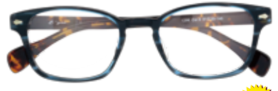
made in China 1286