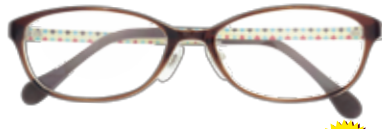
made in China TR9192