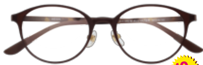
made in China AE025