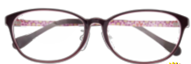
made in China TR9207