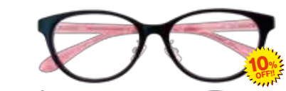
ubu Flower & Lace ubu448