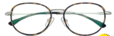
made in China 2324 C6-2