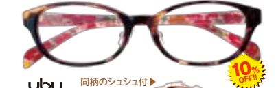
ubu Flower & Lace ubu453